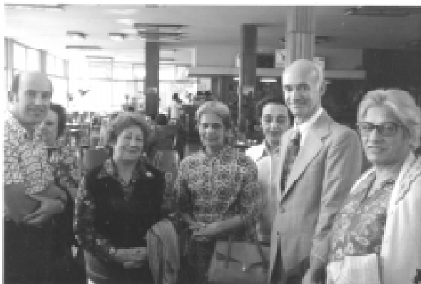
Junio de 1977 Visita de Radha Burnier a la Argentina